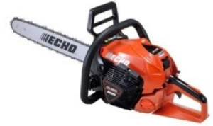
CS-4510ES /45 S95