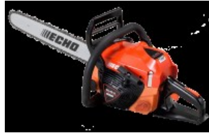
CS-4010 /38 S95