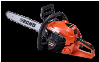
CS-4520 /45 S95